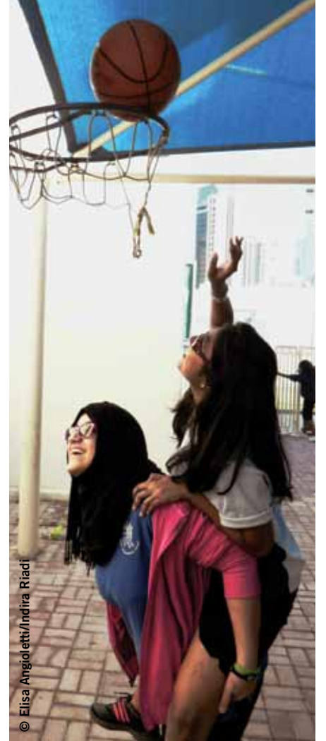
Dünyanın Etrafında Koş Festivali'nde basketbol oynayan kız çocukları, Katar, Aralık 2011.