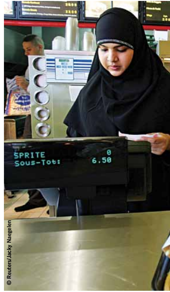
Clichy-sous-Bois mahallesinde bir fast-food restoran olan BKM çalışanları, Paris, Fransa, Ağustos, 2005.