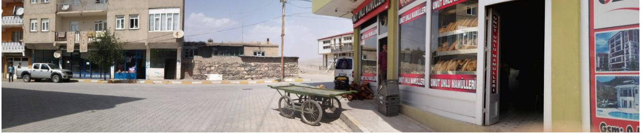
Sağ köşe çocukların çalıştığı fırın pikabın arkasındaki mekan da odunluk