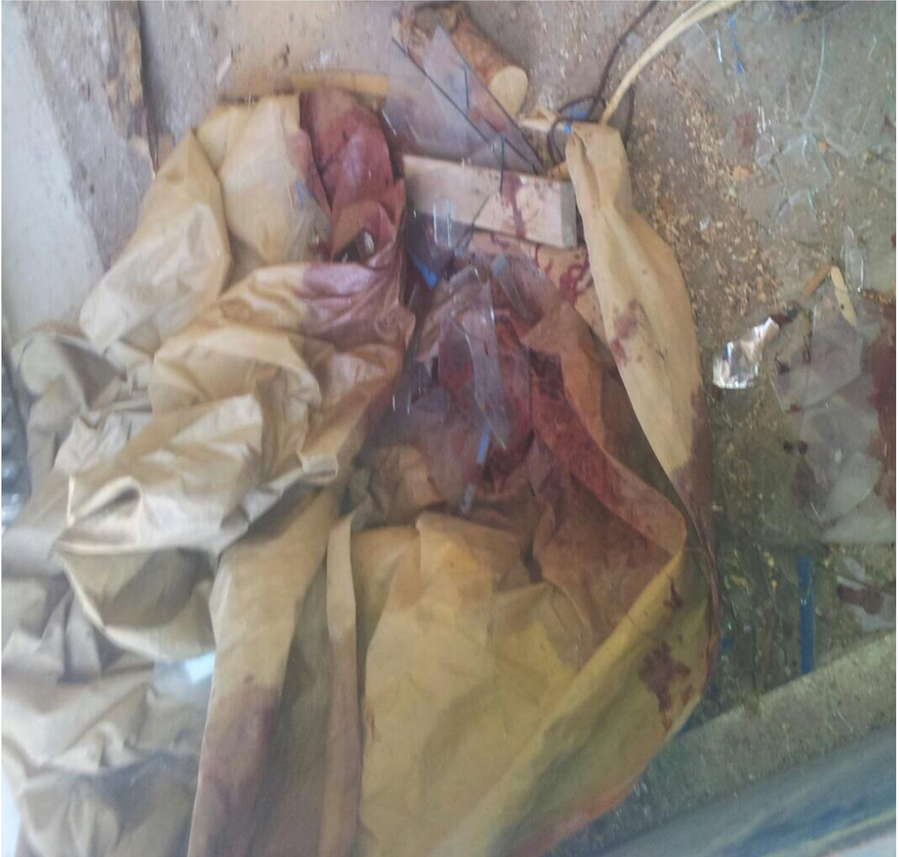
13 Ağustos günü sabahında odunlukta çekilen görüntüler.