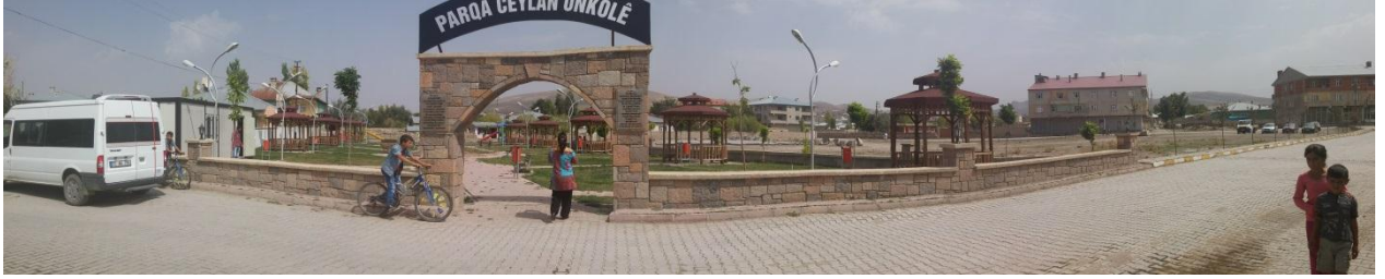
Diyadin'de parklar ve sokaklar bomboş