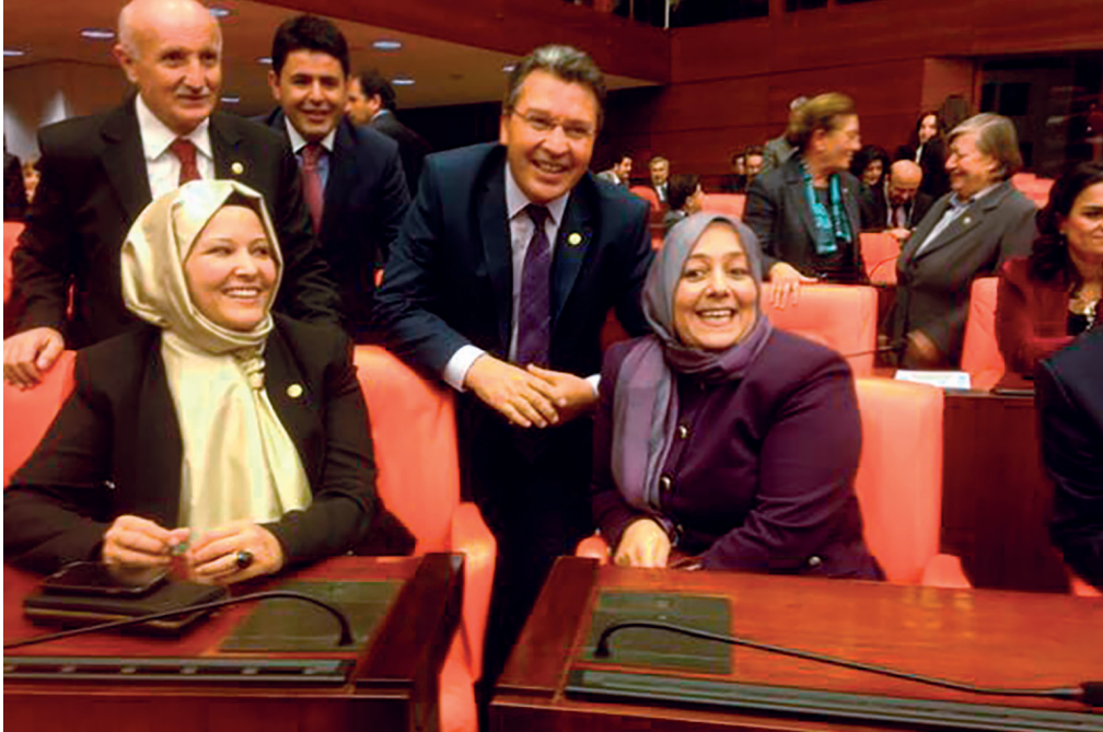
5 Kasım 2013'te AK Partili kadın milletvekilleri Meclis'e başörtüsüyle girdiler.

Kamu görevlilerinin kılık kıyafetini düzenleyen yönetmelikte Ekim 2013'te yapılan değişiklikle kamu görevlilerinin başörtüsü takması önündeki engeller kaldırılmıştır. 93 Ancak, Emniyet hizmetleri sınıfına mensup olanlar, hâkimler, savcılar ve Türk Silahlı Kuvvetleri'nde görev yapan personel bu düzenlemenin dışında bırakılmıştır. Türkiye Büyük Millet Meclisi'ne ilk kez bazı kadın milletvekillerinin başörtüsü ile girmesi ile başörtüsüne ilişkin Meclis'teki fiili engelleme de ortadan kalkmıştır. 94