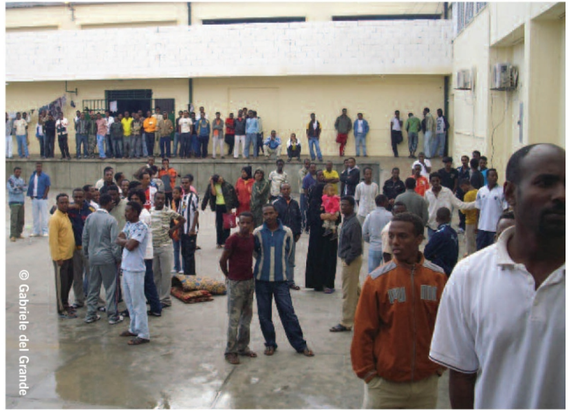
Misurata Gözaltı Merkezi'nin bahçesindeki mülteci ve göçmenler, Kasım 2008.

Uluslararası Af Örgütü ve diğer insan hakları gruplarının yaptığı araştırmalar, Libya'da, hem devrik lider Kaddafi'nin iktidarı döneminde hem de Kaddafi'yi deviren iç karışıklık sırasında ve sonrasında mülteci, sığınmacı ve düzensiz göçmenlere karşı geniş çapta insan hakları ihlalleri gerçekleştirildiğini ortaya koydu. Belgelendirilen ihlaller, çok kötü şartlar altında uzun süreli gözaltıları, dayak ve kötü muameleyi, hatta bazı durumlarda işkenceye kadar varan durumları içeriyor. Mülteci ve sığınmacılar ayrıca geri gönderilme (bir bireyin idam veya çeşitli ciddi insan hakkı ihlali ile karşılaşabileceği bir ülkeye zorla geri gönderilmesi) tehlikesi ile karşı karşıya. Libya, Mülteci Statüsü ile ilgili 1951 BM Sözleşmesi ve 1967 Protokolünün taraflarından biri değildir.