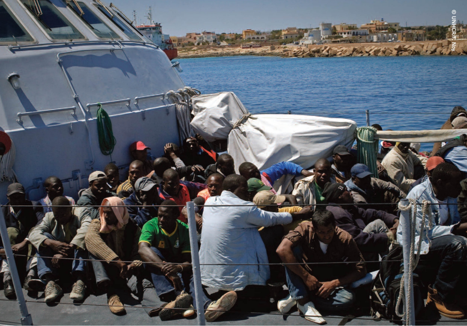
Bu insanlar, Akdeniz'de bir tekneden kurtarılan ve altı İtalyan deniz aracı ile Lampedusa, İtalya'ya götürülen 500 kişiden bazıları, Mayıs 2011