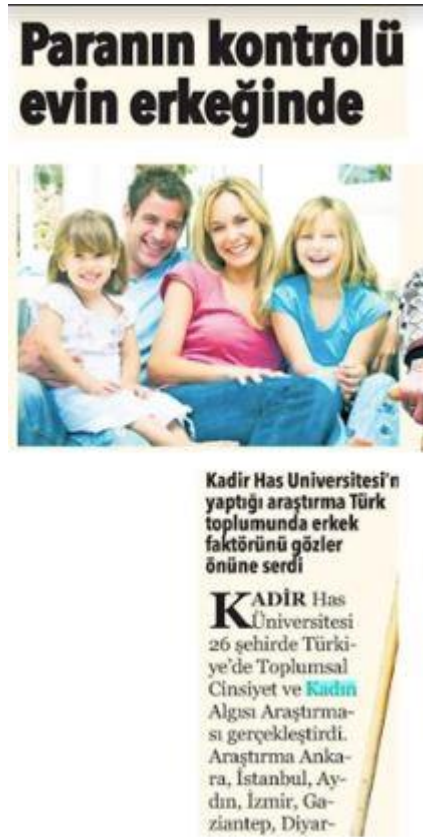
Figür 13: Karadeniz, 11.05.2015

Haber yazımlarında sebep-sonuç ilişkisinin nasıl kurulduğunu incelediğimiz alt başlıkta (bkz. Bölüm 1.4, Figür 11-12), haber başlıklarının bir yargıyı mı, bir olayı mı bildirdiğinin belirsiz olduğunu, normatif dil ve olgusal dilin birbirine karıştığını gözlemledik. Yani bu tür başlıkların hukuki, toplumsal, kültürel bir normu mu dile getirdiği; yoksa belirli bir zamanda belirli bir yerde belirli kişilerin karıştığı bir olayı mı tarif ettiğinin belirsiz olduğunu gördük. Örneğin, bekâretin bir cinayet sebebi olabileceğine dair genel bir ifade, olgusal mıdır yoksa normatif midir? Yargıtay kararı haberleştirilirken kararın olduğu gibi başlığa taşınması, olgusal ve normatif dil arasında bir geçişkenlik yaratırken, mevcut olgularla normatif olanın sınırlarının muğlaklaşmasına neden olur.