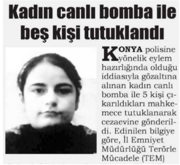
Figür 3: Ankara Anadolu, 11.05.2016