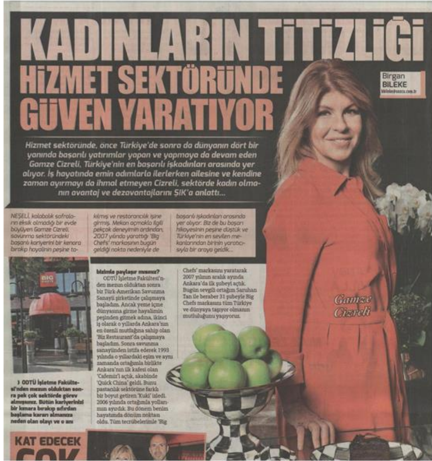
Figür 21: Sözcük Şık Eki, 21.12.2015

Bu bölümde rapora eklediğimiz diğer iki haber, gazetelerin magazin eklerindedir. Makbul kadın haberleri, sıklıkla ünlü kadınlarla ilgili özel haberler ve onlarla yapılan röportajlara dayandırılır. 31 Aralık 2015 tarihli Milliyet Cadde haberinde (Figür 20), bir kadın oyuncuyla yapılmış röportaj yer alıyor. Özel haber ve dosyalarda genellikle habere konu olan kişinin özel çekilmiş fotoğrafları kullanılır. Bu röportajda da oyuncu sade bir kıyafetle poz vermiş ve fotoğrafının üzerine de röportaj başlığı olarak “Evdeki Mutluluk İşime Yansıyor” başlığı atılmıştır. Kadın çalışıyorsa, hele de makbul olanın sınırlarında gezen ünlü bir oyuncuysa, yani her an makbul olmayan tarafa düşebilecekseniz, röportaj ve özel haberler genellikle onların işleriyle evlilikleri arasında nasıl bir uyum olduğunu göstermeyi hedefler. Öyle ki, bu oyuncu evindeki mutluluk sayesinde işini de iyi yapabiliyordur.