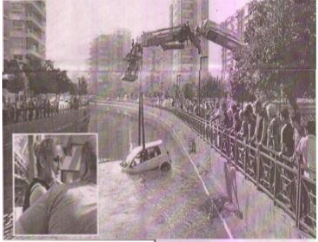
Figür 5: Adana Kent, 23.06.2015

Eylemin niteliğine göre, kadınlığa yapılan vurgunun yarattığı etki değişir: öfke, acıma, tiksinti ya da aşağılama duygularını harekete geçirir. Haberde araştırma ekibini huzursuz eden, her zaman bilgiye ya da ideolojiye dayalı bir cinsiyetçilik değil, bazı durumlarda sıra dışılıktan çıkan bu negatif duygulardır. Haberi hazırlayan ekip, okur ve araştırma ekibi ortaya çıkan negatif duygulardan farklı biçimlerde etkilenirler. Örneğin “Kadın sürücü aracıyla sulama kanalına uçtu” haberindeki kadın sürücü ifadesi, kimi okuru güldürebilir, kimisinde acıma duygusu uyandırabilir, kimisini öfkeliendirebilir, kimisini rahatsız edebilir, kimisinin ise dikkatini bile çekmez. Mevcut bağlamda, cinsiyet kimliğine dair bu fazla ve gereksiz bilginin yukarıda bahsi geçen toplumsal cinsiyet rejimine yaptığı katkı önemlidir. Bu açıdan bu haberler, anahtar sözcük üzerinden medya izleme ve raporlama çalışmalarında en kolay bulunabilecek –ve aynı zamanda göz ardı edilebilecek– haberler olsalar da, bu tür cinsiyetlendirilmiş haberlerin yarattığı etkiler üzerine tartışmak ve ikincil araştırmalar yürütmek gerekir.