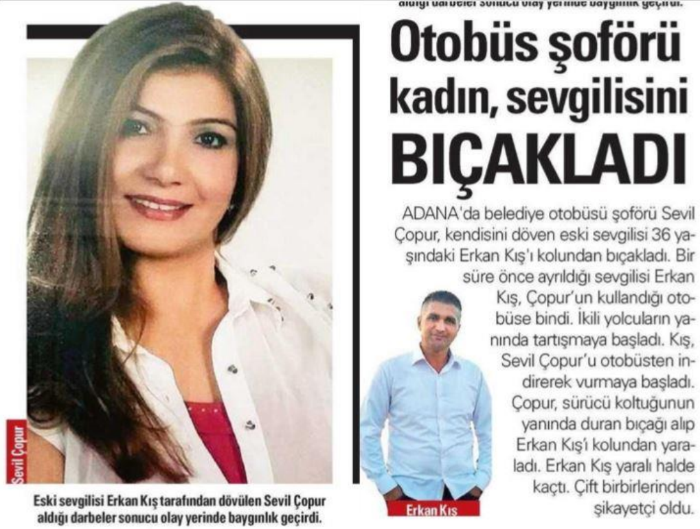
Figür 6: Akşam, 06.11.2015

6 Kasım 2015 tarihli Akşam gazetesi haberi (Figür 6) ise, “cinsiyetçi haber nasıl yapılır” konusunda ders niteliği taşıyor. Haber metninden başlığa taşınan detayların hiçbiri olayın ana eksenine dair değil veya bir çarpıtmaya dayanıyor: Kadının otobüs şoförlüğü yapıyor olması konuyla ilgili değil; bıçaklanan kişinin kadının sevgilisi olduğu doğru değil; olay bir bıçaklanma vakasından ibaret değil. Kadının kullandığı otobüse saldıran erkeğin manşette sözü edilmezken ve kullanılan fotoğraflarda da erkek ikincil konumdayken, kadın esas fail olarak göze çarpıyor. Kadının güzel ve bakımlı bir fotoğrafı da seçilerek haberin görsel cazibesi arttırılırken haberdeki sansasyon da yükseltiliyor. Haber çarpıtılarak kadın failleştiriliyor, suçlulaştırılıyor, güzel bir fotoğrafı kullanılarak çelişkinin etkisi arttırılıyor; bütün bunlar bir araya getirilerek kadının failliği kurgulanırken makbul ve makbul olmayanın da sınırı çizilmiş oluyor.