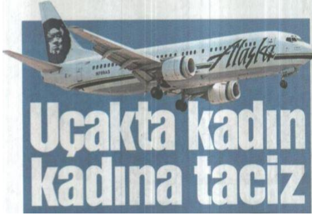
Figür 2: Sözcü, 11.05.2016

Failin cinsiyeti, çoğu zaman habere özel ve sıra dışı bir anlam katar. Bu haberler suç içeren eylemler, başarı hikâyeleri veya kaza haberleri olabilir. Haber, “kadın kadına taciz” (Figür 2), “kadın canlı bomba” (Figür 3), “kadın hırsız” (Figür 4), “kadın şoför” (Figür 5) başlığıyla ilgi toplamaya çalışır. Failin cinsiyetinin altı çizilir, büyük puntolar kullanılarak vurgulanır. Örneğin, Ankara Anadolu gazetesinin 11 Mayıs 2016 tarihli “Kadın canlı bomba ile beş kişi tutuklandı” haberinde failin cinsiyeti, haberin konusunda başat bir nitelik taşımasına rağmen vurgulanıyor. Diğer faillerin cinsiyeti varsayılan olarak kabul edilerek haberde dile getirilmiyor; başka bir deyişle, canlı bomba eylemcilerinin cinsiyeti erkek olarak varsayılıyor. Kadın fail, makbul kadınlıktan sapma gösterdiği için parlatılıyor ve haberin manşetine taşınıyor.