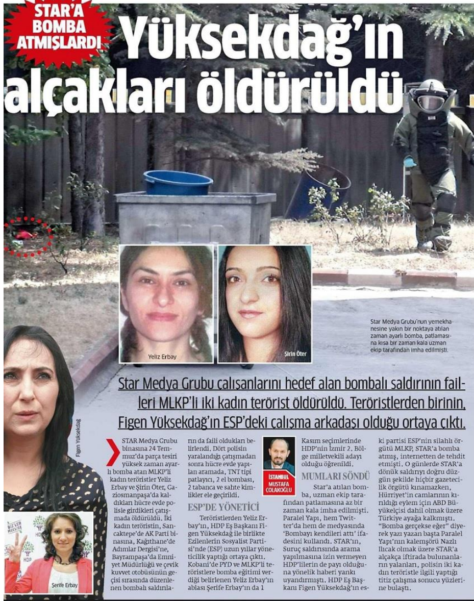
Figür 27: Star, 23.12.2015

Böyle bir temsil Star gazetesinin 23 Aralık 2015 tarihli “Yüksekdağ’ın alçakları öldürüldü” başlıklı haberinde yapılıyor. Haberin alt başlığında bir bombalama eyleminin faili olduğu iddia edilen iki kadının, evlerinde polisle silahlı çatışma esnasında öldürüldükleri ifade ediliyor. Failerin kadın olduğunu vurgulamanın yanı sıra, bir tanesinin başka bir siyasetçi olan HDP Eş Genel Başkanı Figen Yüksekdağ ile aynı siyasi parti geçmişinden geldiği belirtiliyor. Failerin kadın kimliği ve siyasi geçmişlerinin benzerliğinin izi sürülüyor. Haberde kullanılan görseller arasında en büyüğü Figen Yüksekdağ’ın fotoğrafıdır. Başlıkta yine kelime oyunu ile üretilen nefret dili, failere ve failerle ortak siyasi geçmişi olan bir özneye yöneliyor. Ancak haberdeki nefret söylemi bununla bitmiyor. Siyasi ayrımcılık sadece cinsiyetçilikle değil, aynı zamanda dini ayrımcılıkla da güçlendiriliyor. Zira haberin alt başlıklarından biri de “Mumları Söndü” ifadesidir. Bu nefret ifadesi haberde bahsi geçen bombalama eylemine şüpheyle yaklaşan gazetecilere yönelik olarak kullanılıyor. Öldürülen kadınların mensup oldukları yahut onlara yakıştırılan Alevi kimliğine yönelik yaygın olarak kullanılan “Mum Söndü” ifadesi bu sefer bombalama eylemiyle ilgili haber ve yorum yapan gazetecilere yönelik olarak kullanılıyor.