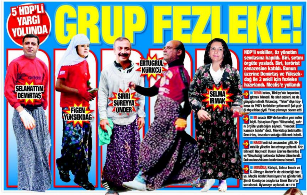
Figür 26: Takvim, 10.03.2016

Haber bunun da ötesinde hiçbir bilgi içermemesiyle dikkat çekiyor. Yani belirli bir olayla ilgili bilgi vermek yerine, kimliği belirsiz insanları aşağılayıp, kadınlığı da güldürü unsuru olarak kullanıyor.