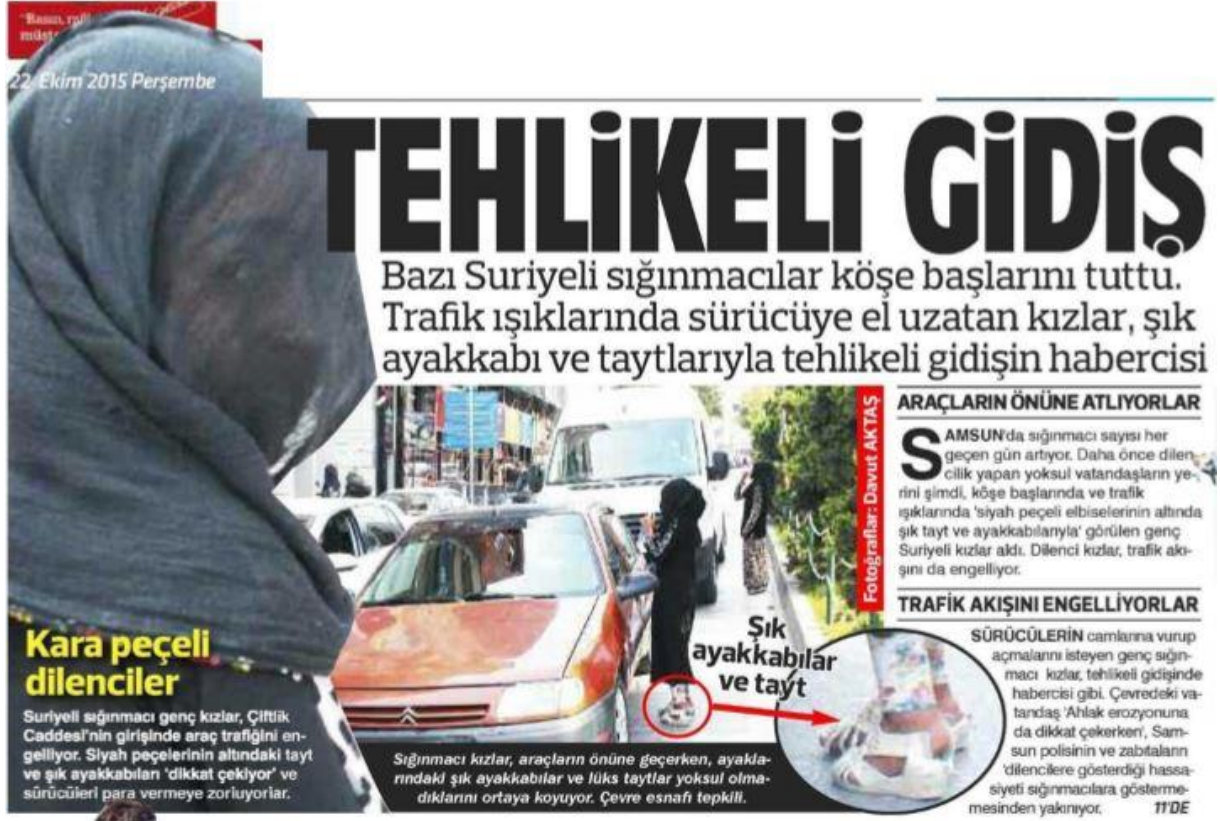
Figür 22: Samsun Halk, 22.10.2015

Toplumsal cinsiyet rejimi, kadınlık ve erkekliği makbul ve makbul olmayan diye ayırırken aynı zamanda etnik, dini, siyasi ve sınıfsal ayrımlarla da işbirliğine girer. İrkçılık, etnik kimlik, din ve siyasi görüş temelli ayrımcılıklar, medyada cinsiyetçiliğe yeni ve çeşitli ifade biçimleri kazandırır. Bu açıdan nefret söylemi taramasında kadın sözcüğünün geçtiği haberlerin yanında, etnik ve din temelli ayrımcılık örneklerinin karşımıza çıkardığı cinsiyetçiliği de mümkün olduğunca takip ettik.