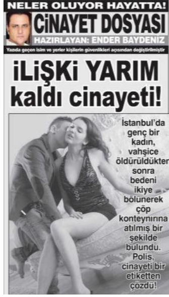
Figür 10: Şok, 29.06.2015

Bir diğer örnekte; Şok gazetesinin 29 Haziran 2015 tarihli kadın cinayeti haberi için seçilen “İlişki Yarım Kaldı Cinayeti” başlığı ve temsili bir erotik kadın-erkek görselidir. Canavarca işlenen bir kadın cinayetinin gerekçesi cinsellikle ilişkilendirilerek başlığa taşınır; bunun yanında büyük ihtimalle katile ve maktule ait olmayan bir fotoğrafla cinayet hikâyesi, cinsel bir birlikteliğin son sahnesi olarak yeniden kurgulanır. Bir kadın cinayeti, sıradışı/ahlakdışı bir kadınlık hikâyesine, kadınlık da cinselliğe tercüme edilerek cazip bir hikâyeye dönüştürülür ve hızla tüketilmesi için okuyucuya servis edilir.