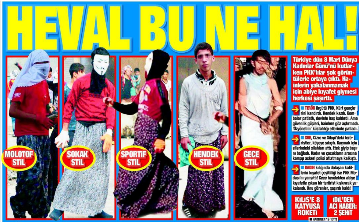
Figür 25: Takvim, 09.03.2016

Yükselen kutuplaşmalar, çatışmalar ve savaş durumu, siyasi ayrımcılığın medyada kendine en sert şekilleriyle yer bulmasına neden olur. Etnik ve dini ayrımcılıklar gibi bu çerçevede ele aldığımız haberler de hem ‘kadın’ anahtar sözcüğüyle, hem de nefret söylemi taramalarında kullanılan diğer kelimelerle araştırma ekibinin karşısına çıkmıştır.