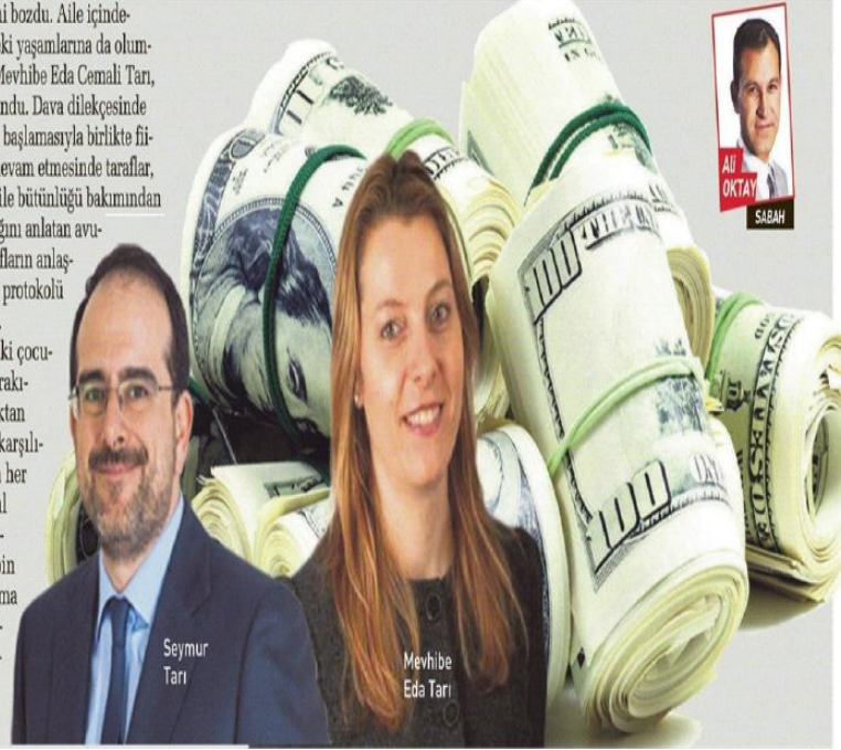
Figür 9: Sabah Avrupa, 15.07.2015