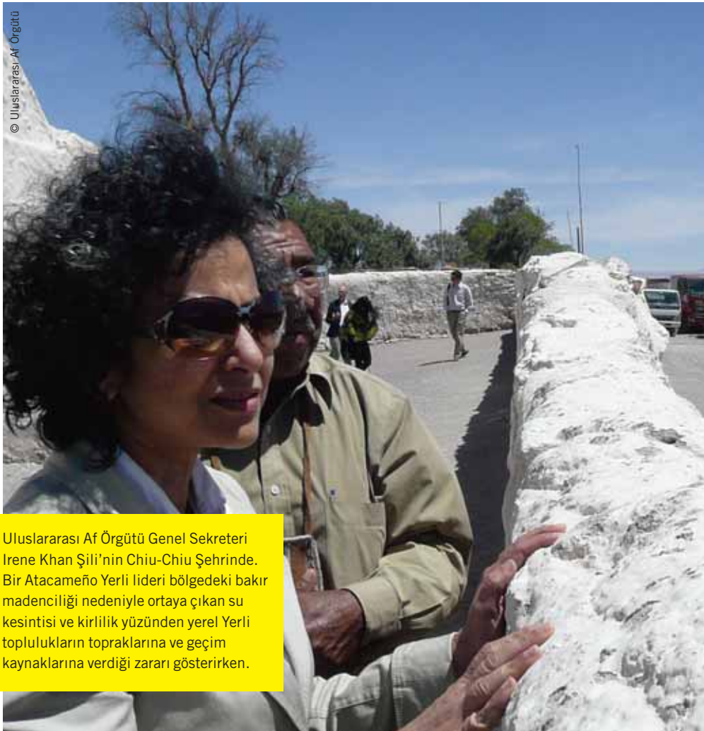
Uluslararası Af Örgütü Genel Sekreteri Irene Khan Şili'nin Chiu-Chiu Şehrinde. Bir Atacameño Yerli lideri bölgedeki bakır madenciliği nedeniyle ortaya çıkan su kesintisi ve kirlilik yüzünden yerel Yerli toplulukların topraklarına ve geçim kaynaklarına verdiği zararı gösterirken.