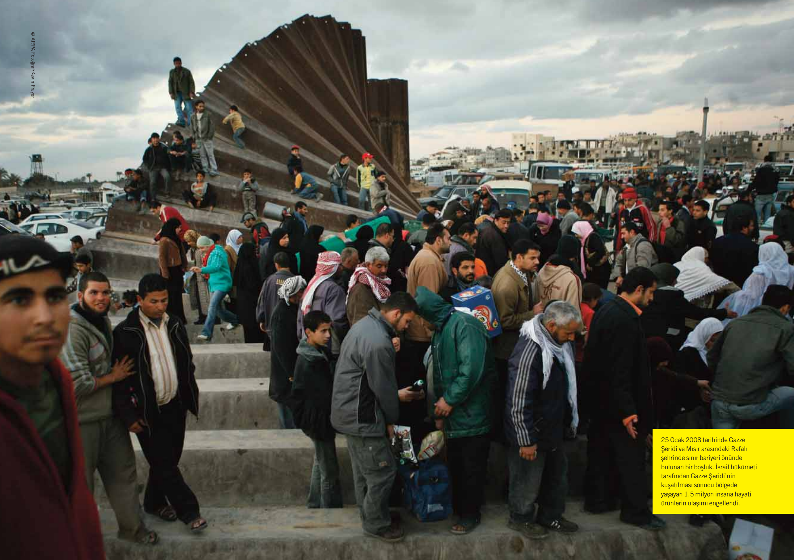
25 Ocak 2008 tarihinde Gazze Şeridi ve Mısır arasındaki Rafah şehrinde sınır bariyeri önünde bulunan bir boşluk. İsrail hükümeti tarafından Gazze Şeridi'nin kuşatılması sonucu bölgede yaşayan 1.5 milyon insana hayati ürünlerin ulaşımı engellendi.