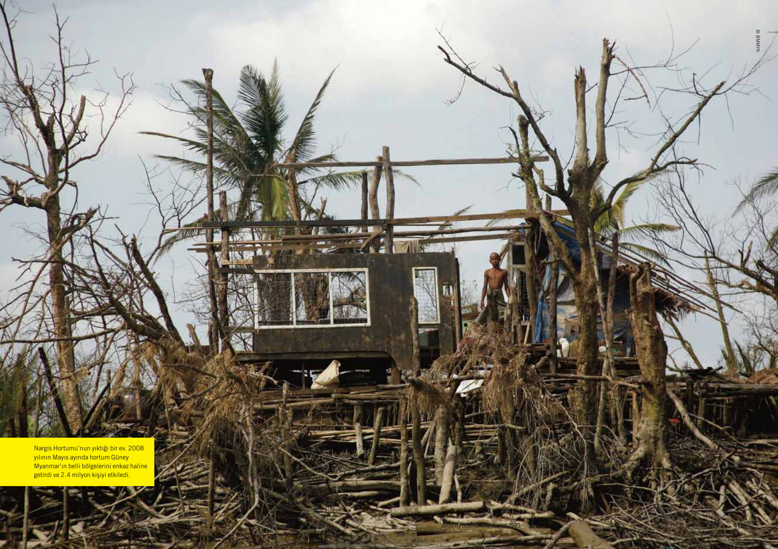
Nargis Hortumu'nun yıktığı bir ev. 2008 yılının Mayıs ayında hortum Güney Myanmar'ın belli bölgelerini enkaz haline getirdi ve 2.4 milyon kişiyi etkiledi.