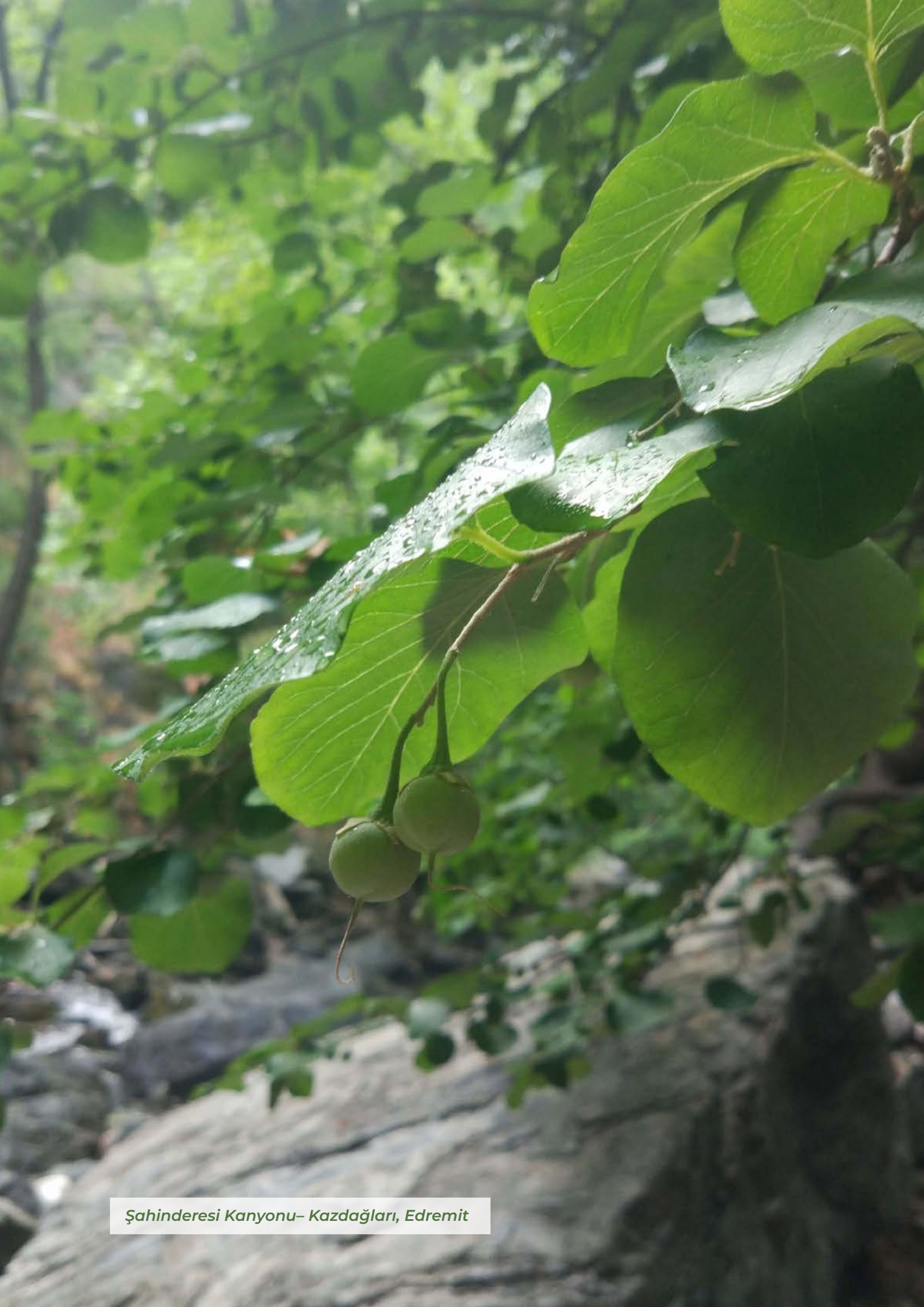
Şahinderesi Kanyonu- Kazdağları, Edremit