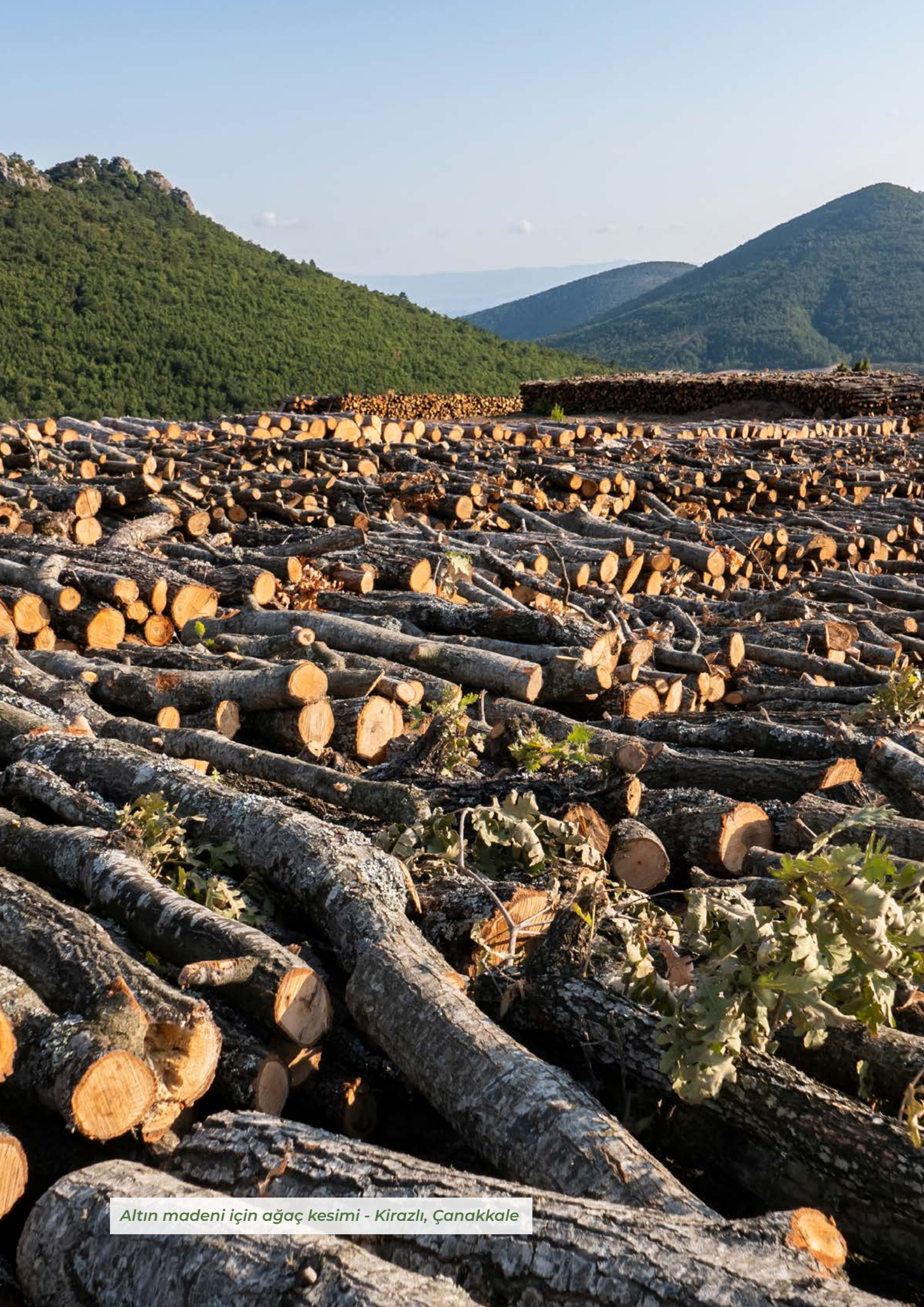
Altın madeni için ağaç kesimi - Kirazlı, Çanakkale