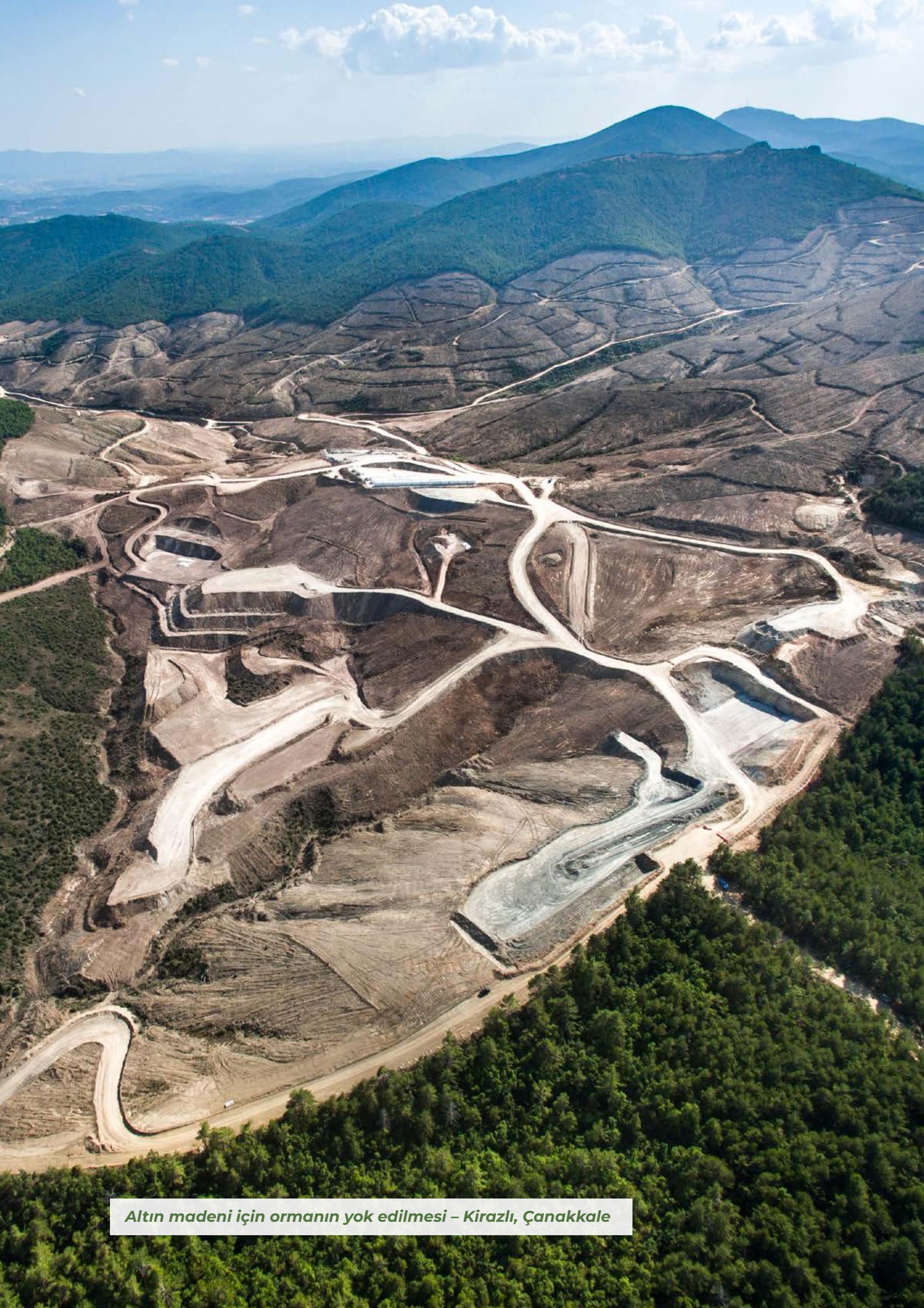
Altın madeni için ormanın yok edilmesi – Kirazlı, Çanakkale