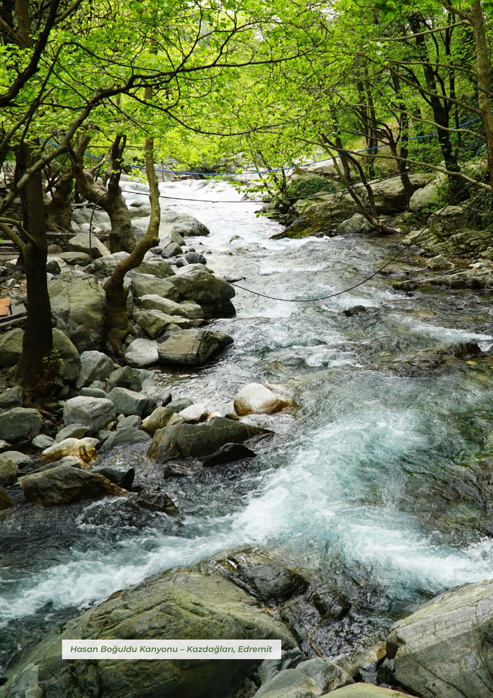
Hasan Boğuldu Kanyonu – Kazdağları, Edremit