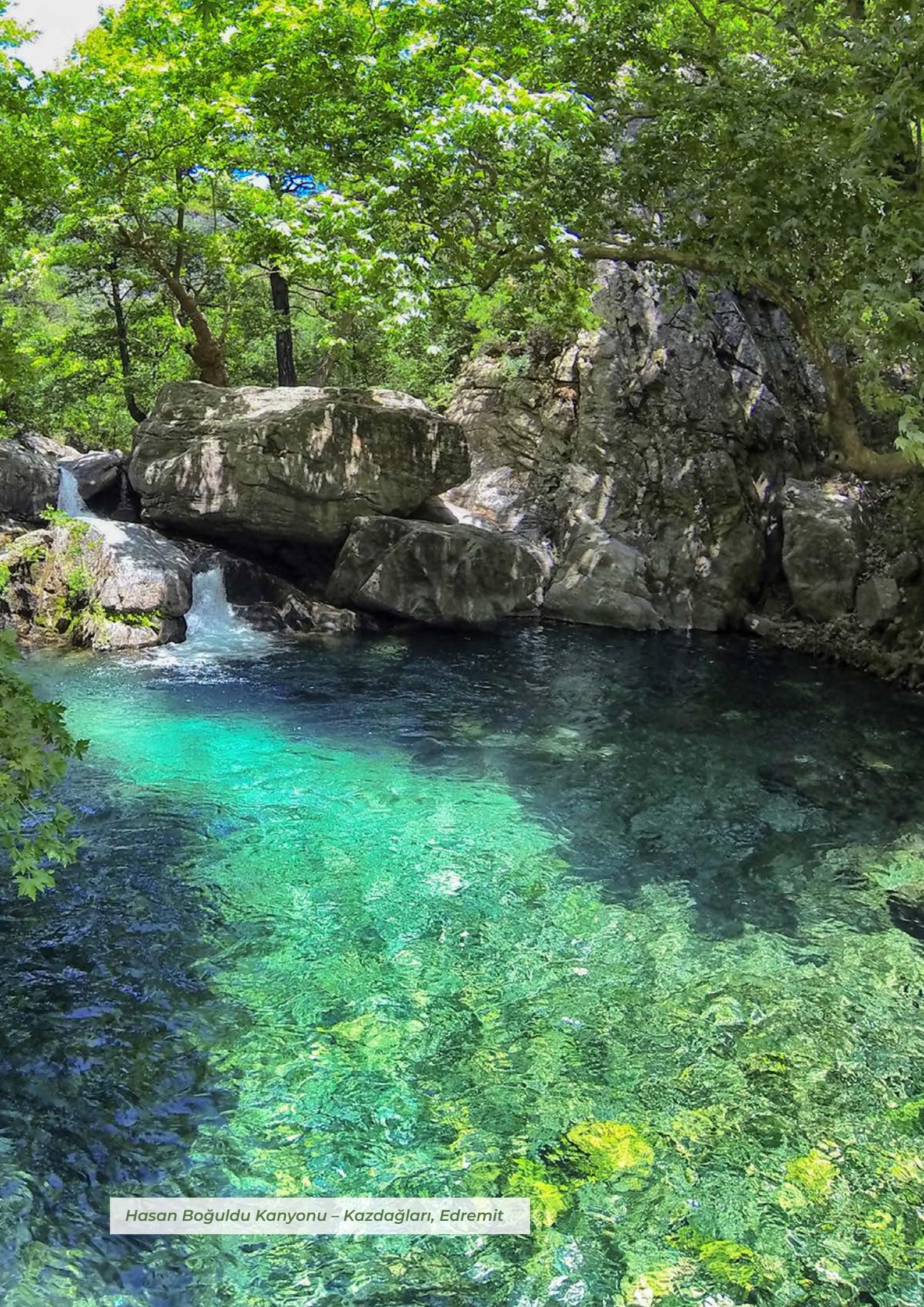
Hasan Boğuldu Kanyonu – Kazdağları, Edremit