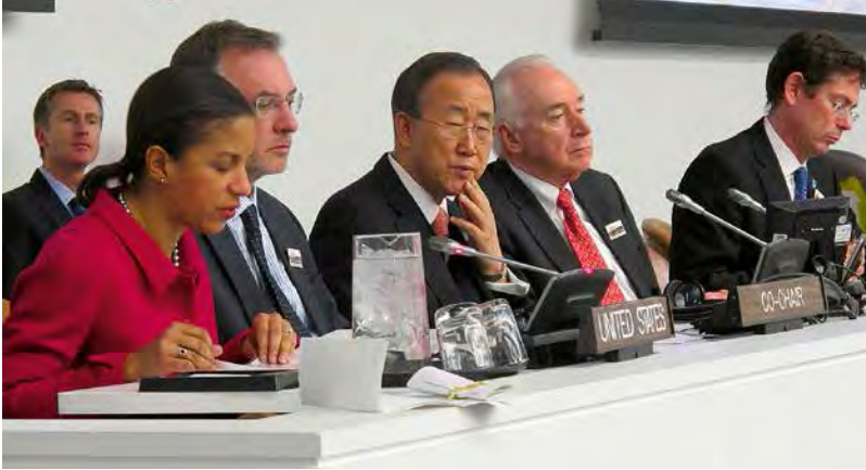
Birleşmiş Milletler Genel Sekreteri Ban Ki-moon, New York'taki Birleşmiş Milletler Merkezi'nde LGBT'lerin eşitliği hakkında bir tartışmada, 10 Aralık 2010

Ayrımcılık yasağı ilkesi pek çok konuda karşımıza çıkmaktadır ve bu konuda Devletlerin yükümlülüğü acildir. Basitçe söylenecek olursa, cinsel yönelim ve cinsiyet kimliği sebebiyle insanlar haklarından yararlanma konusunda ayrımcılığa uğratılamazlar. Yüksek Komiser'in de belirttiği üzere "Evrensellik ilkesi istisna kabul etmez. İnsan hakları tüm insanların doğuştan hakkıdır." 3