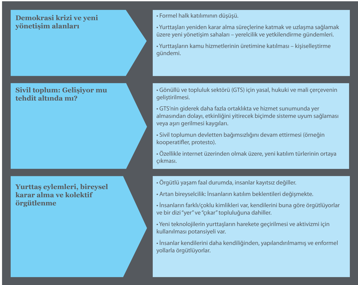
Şekil 1: Katılımı etkileyen temel gelişmeler ve itici güçler