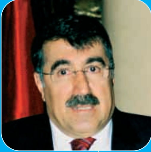
İçişleri Bakanı, Abdülkadir Aksu