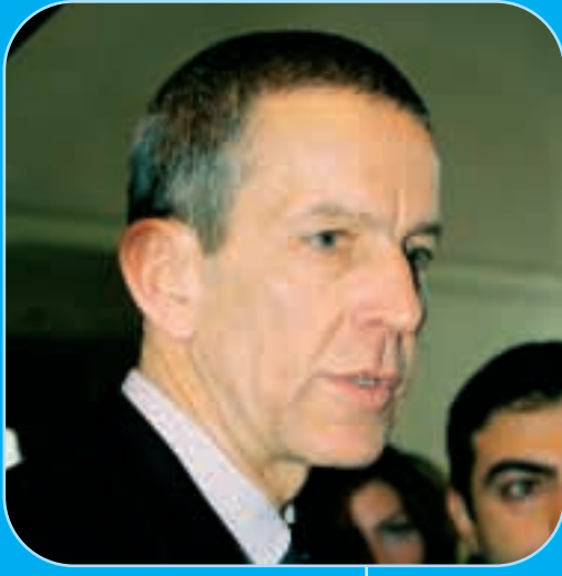
Avrupa Komisyonu Türkiye Delegasyonu Başkanı, Büyük Elçi Hansjörg Kretschmer

TC Hükümeti'nin 2005 yılı Ağustos ayında başlattığı yeni çocuk koruma projesinin resmi açılışı 20 Ocak 2006 tarihinde Ankara'da Hilton Oteli'nde yapıldı. Türkiye'de Çocuklar için İyi Yönetişim, Koruma ve Adalete Doğru veya Önce Çocuklar, Türkiye'de başta en dezavantajlı konumda olanlar olmak üzere ülkedeki bütün kız ve erkek çocukların haklarının ön planda tutulduğu, çocuk bakımı ve korunması alanında bir dizi değişikliğe tanıklık edecek.