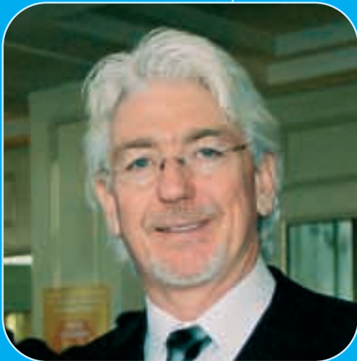
UNICEF Türkiye Temsilcisi Edmond McLoughney