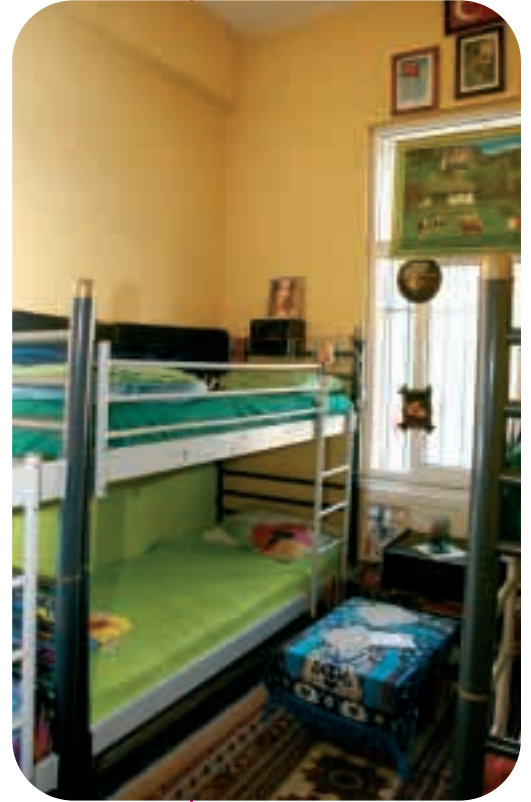
İzmir Buca Çocuk Eğitimevi'nde çocuk odalarından biri

Üç kurumdaki personelin genel kanısı, eğitimlerin daha uzun ve detaylı olması, bu eğitimlere düzenli tazeleme kurslarının eşlik etmesi, çocuk hakları ve ekip çalışması konularında daha fazla eğitim yapılması gerektiği yönündedir.