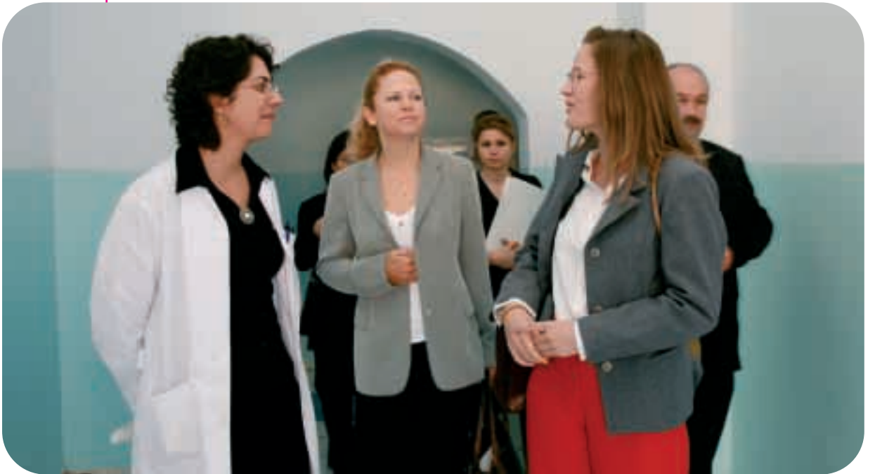
Personel, Önce Çocuklar proje ekibine İzmir Buca Çocuk Eğitimevi’ni gezdireyor

Bergama Çocuk Tutukevi’nde 212 çocuk ve 40 infaz koruma görevlisi bulunmaktadır. İki psikolog, çocuklar ve ziyarete gelen aileleri ile eğitim yapabilmektedir. Personel sayısı sınırlı olduğundan çocukların katılımı rotasyon usulü sağlanmaktadır. Çocuklarda gece geç vakitlere kadar yatmama eğilimi vardır. Bu da sorun yaratmaktadır çünkü gece vardiyasında çalışanların sayısı sınırlıdır ve psiko-sosyal personel gece kurumda bulunmamaktadır. Bununla birlikte personel, eğitimlerin başlamasından bu yana çocukların davranışları üzerinde daha etkili olabildiklerini belirtmiştir; çocuklar da bu eğitime daha fazla iletişime girerek yanıt vermektedir.