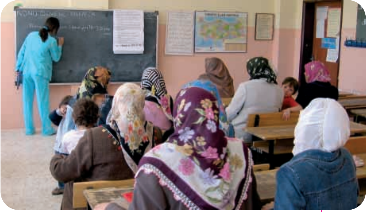
Van'da Benim Ailem eğitimi: tahtada yazılı konu başlığı "güvenli annelik"

Bu mektupta yer verilen noktalara ilişkin görüşleri alındığında babaların çoğu konuya özellikle ana baba eğitiminin olumlu sonuçlarına değinen öykülere ilgi duyduklarını belirtmiş, aileleriyle iletişimlerini geliştirme konusuna olumlu yanıt vermiştir. Kampanyayla birlikte eğitimlere katılan babaların sayısında kayda değer bir artış görülmüştür; bununla birlikte, katılan babalar annelere göre halen düşük orandadır. Babalara mektup girişiminin başarılı olduğu ve yaygınlaştırılması gerektiği genel olarak kabul görmektedir.