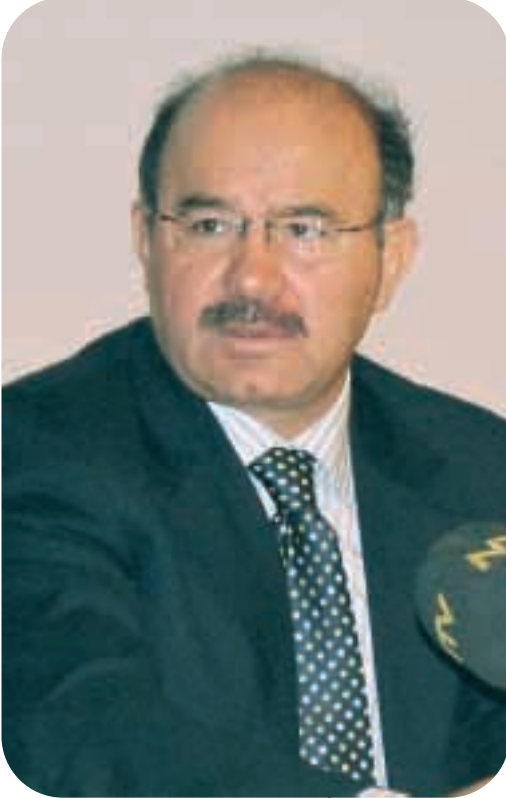
Milli Eğitim Bakanı Doç. Dr. Hüseyin Çelik 13 Ekim 2006'da Elazığ'da

Telafi eğitimi ihtiyaç analizi ile ilgili saha çalışması Ağustos 2006'da başlamıştır ve MEB Türkiye'de telafi eğitimi ile ilköğretim arasındaki en etkili geçiş sistemini belirlemek üzere çeşitli uygulama modellerini inceleyecek bir