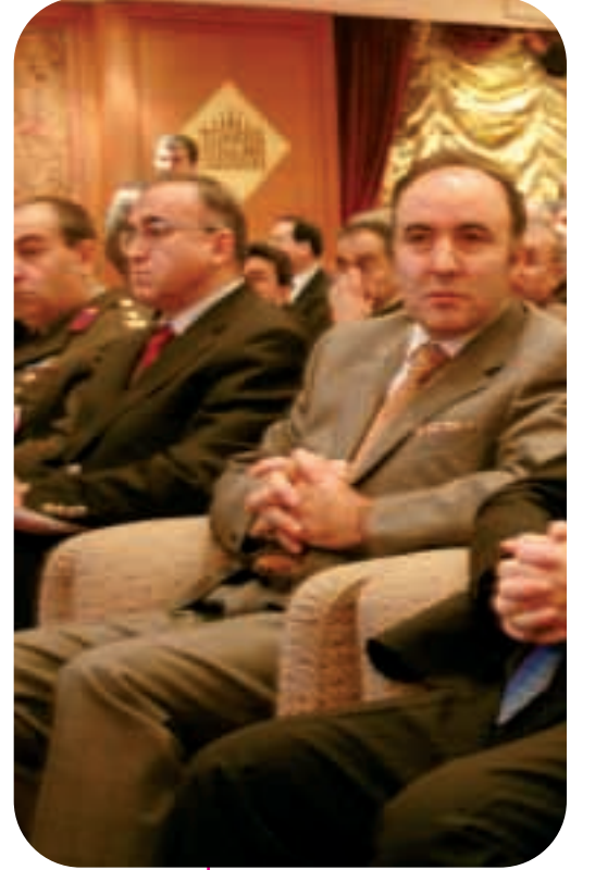
Çocuklara ilişkin 25 Yaşam Kalitesi Göstergesi 6 Kasım'da Gaziantep'te açıklandı