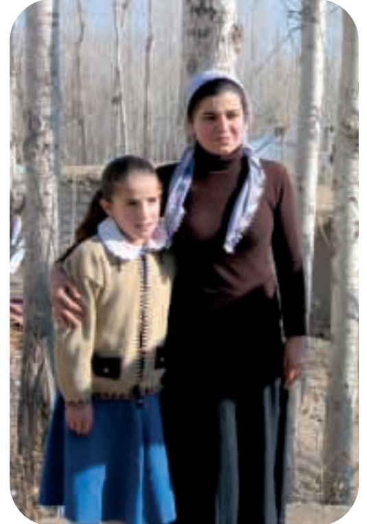
Hizmetlere erişimin güç, çocuk yoksulluğu oranlarının ise yüksek olduğu kırsal yörelerdeki ailelere ulaşılması Benim Ailem programının öncelikleri arasındadır

Kısa paket bu açıdan önemli bir rol oynayacaktır; çünkü kırsal kesimdeki ana babaların eğitimi tamamlamaları daha kolay olacak, ayrıca mesajlar daha özlü verildiğinden bunların okuma yazması sınırlı kişiler tarafından bile anlaşılması mümkün olabilecektir. Bu merkezler ancak ilçe ve il merkezlerinde olduklarından, Halk Eğitim Merkezlerine devamlılık da birçok kişi açısından sorunlu olmaktadır. Bir çözüm yolu olarak ilkokullardan eğitim mekanları olarak yararlanılması ve böylece hem seyahat masraflarının azaltılması hem de katılımın kolaylaştırılması yoluna gidilmiştir.