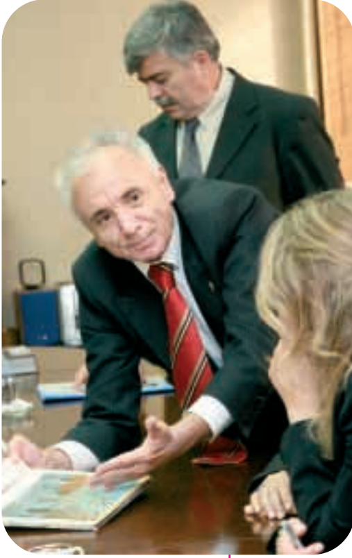
Ekip İzmir Cumhuriyet Başsavcısı ile çocuk tutukevleri konusunu görüştü

Önce Çocuklar projesinden bir ekip, özgürlüklerinden yoksun kalmış çocuklarla ilgilenen görevlilere verilen eğitimin etkilerini izlemek üzere 2006 yılı Ekim ayında Bergama, İzmir ve Kayseri’de Adalet Bakanlığı’na bağlı kurumları ziyaret etti.