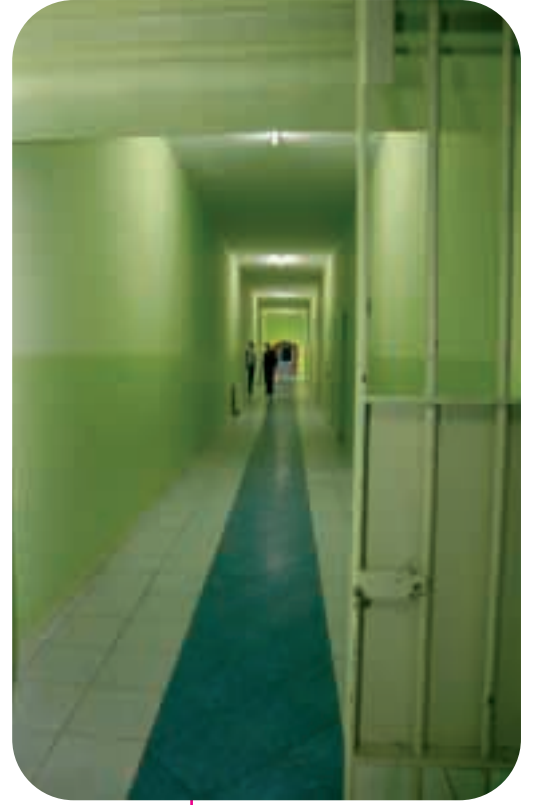
İzmir Buca Eğitimevi'nin iç görünümü

İçişleri Bakanlığı ve Türkstat 25 göstergeli sistemin eşgüdümünden ve izlenmesinden sorumlu personeli belirlemiştir ve DevInfoTürk 'ün uygulanması ile ilgili bölgesel eğitim çalışmalarına 2007'de başlanacaktır. İçişleri Bakanlığı bütün illerden 2004-2006 dönemine ilişkin verilerini sunmalarını talep etmiştir.