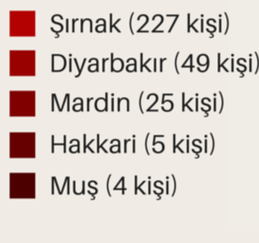
İllere Göre Yaşamını Yitiren Siviller

310 En az 310 sivil sadece resmi sokağa çıkma yasağı ilan edilmiş zaman dilimleri içerisinde, ilgili çatışma ortamlarında yaşamlarını yitirdi.