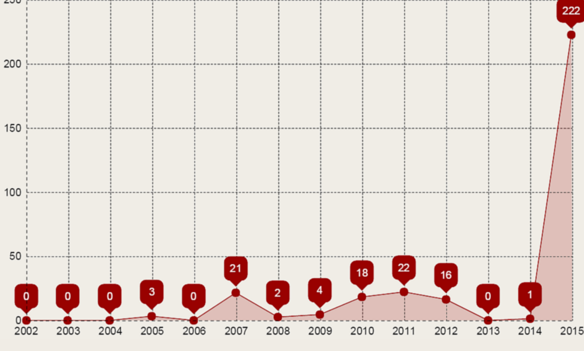
2002 - 2015 Yılları Arasında Çatışmalı Ortamlarda Yaşamını Yitiren Siviller

Meydana gelen her ölümün önemi büyük olmakla beraber, 2015 yılı itibariyle, çatışma ortamlarında yaşamlarını yitiren sivillerin sayısı geçmiş yıllara oranla kıyaslanmayacak ölçüde arttı. Bu ölümlerin çoğu sokağa çıkma yasağı uygulamaları süresince gerçekleşti. 2016 yılının ilk üç ayında da çatışma ortamlarında sivillere yönelik yaşam hakkı ihlalleri devam ediyor.